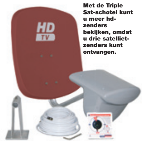
Met de Triple Sat-schotel kunt u meer hd-zenders bekijken, omdat u drie satelliet-zenders kunt ontvangen.