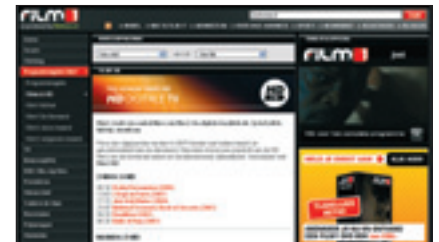
De zender Film1 HD biedt speelfilms in hd-formaat met Nederlandse ondertiteling.