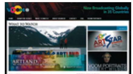
Voom HD biedt voor Europese kijkers lifestyleprogramma's in hd-formaat.