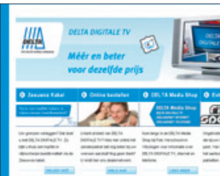
De Zeeuwse kabelaanbieder Delta heeft meerdere hd-zenders in het televisiepakket.

Dit kabelbedrijf is een kleine speler in de markt van Noordoost-Friesland (inclusief Ameland en Schiermonnikoog) en voorziet 25.000 huishoudens van radio en televisie. Het heeft momenteel een bescheiden aanbod van vier hd-zenders. De zenders Brava HDTV en National Geographic HD kunt u vooralsnog gratis via deze kabelaar kijken, op voorwaarde dat u een decoder hebt die de signalen kan weergeven. In de loop van dit jaar komt Kabel Noord met een uitgebreider hd-pakket. Dan komen ook de eerdergenoemde hd-zenders Brava HDTV en National Geographic HD in een betaalpakket. De zenders Film1 HD en Sport1 HD kunt u al tegen betaling kijken. Kabel Noord creëert extra ruimte op zijn kabelnetwerk voor de toekomstige doorgifte van extra hd-zenders, door minder analoge zenders door te geven. De