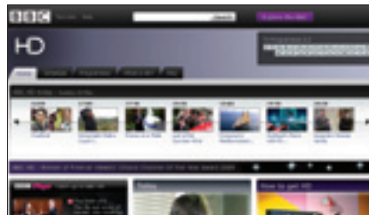
De zender BBC HD kunt alleen via de schotel en kabelaar Delta bekijken.