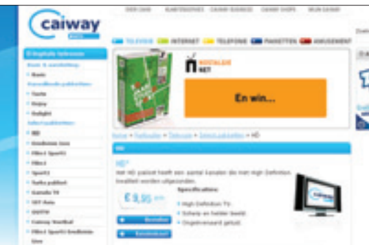
Kabelaar Caiway heeft een behoorlijk aantal hd-zenders in het pakket.

en MGM HD en BBC HD aan het dienstenpakket worden toegevoegd. Of de RTL-zenders ook in hd-formaat beschikbaar komen, is nog niet bekend. Caiway is hierover namelijk nog niet benaderd door RTL Nederland. Maar Caiway is in elk geval bereid om deze zenders in hd-formaat door te geven.