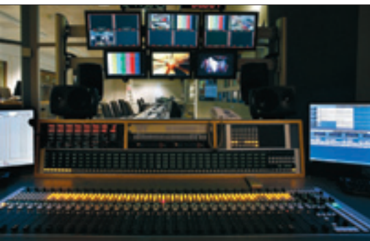
Bij de publieke omroep is de eindregie al geschikt gemaakt voor de doorgifte van hd-uitzendingen.

KPN Interactive of Digitenne televisie kijken. "Deze aanbieders zijn via hun netwerk niet in staat om een hoogwaardig tv-signaal van 12 Mbit/s te distribueren", zegt Egon Verharen. "Wellicht is het in de toekomst door betere encodeertechnieken wel mogelijk, maar momenteel kunnen we niet een kwalitatief hoogstaand hd-signaal in een datastream van bijvoorbeeld 6 Mbit/s proppen." Als alles volgens plan verloopt, kunt u in de loop van 2010 via uw kabelbedrijf met het juiste abonnement ook een selectie gemiste programma's van de publieke omroepen in hd-formaat terugkijken. Die televisieprogramma's roept u op met de afstandsbediening van uw decoder en worden gestreamd vanaf het datacentrum van het kabelbedrijf.