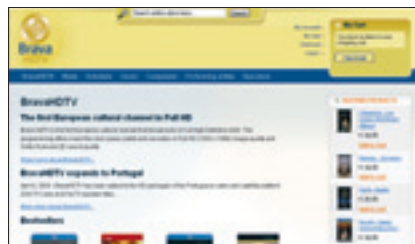
Brava HDTV is een Europese hd-zender die cultuuroprogramma's uitzendt.