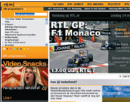
RTL Nederland start dit najaar met hd-uitzendingen van de zenders RTL4, RTL5, RTL7 en RTL8.

SBS Broadcasting brengt de zenders Net5, SBS6 en Veronica in de huiskamer. Het plan is om dit jaar programma's van Net5 in hd-formaat te gaan uitzenden. Volgens woordvoerder Eric Dekker is hier bewust voor ge-