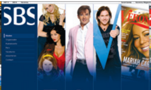
SBS Broadcasting start dit jaar met de doorgifte van Net5 in hd-formaat.

Distributie van hd-televisie gaat vanwege beperkte bandbreedte niet lukken via de netwerken Digitenne en KPN Interactive. Digitenne werkt op basis van de dvb-t-standaard. Hiervan is ook een verbeterde versie beschikbaar, dvb-t2, waarbij het wel mogelijk is om hd-beelden via de ether te versturen. Vooralsnog maakt KPN nog geen gebruik van deze verbeterde techniek. Wel is KPN momenteel aan het experimenteren met