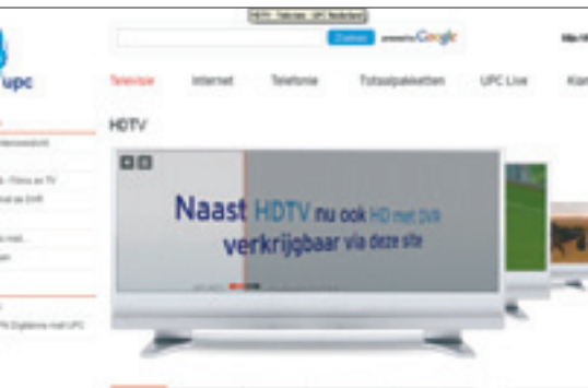
Kabelaar UPC is gereed voor de doorgifte van de Nederlandse publieke en commerciële zenders in hd-formaat.