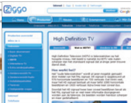
Het hd-aanbod van Ziggo blijft momenteel erg achter bij de rest van de kabels.